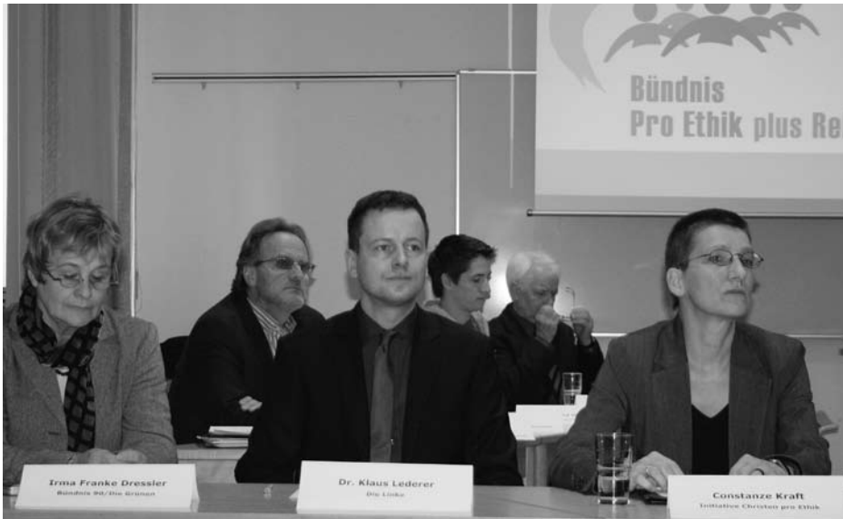
Neben der berlinweiten Postkartenkampagne und Informationsveranstaltungen unterstützt der HVD Berlin aktiv das Bündnis Pro Ethik.

Die Diskussion um den gemeinsamen Ethikunterricht an den Berliner Schulen geht in diesem Monat in die heiße Phase. Am 26. April 2009 sind alle Berliner/-innen aufgefordert, über die Zukunft des gemeinsamen Ethikunterrichts abzustimmen. Der HVD Berlin möchte den Status Quo – Ethikunterricht als Pflichtfach und Religion und Lebenskunde freiwillig – beibehalten. Neben seinen Aktivitäten im Bündnis „Pro Ethik plus Religion“, das am 4. März 2009 den Startschuss seiner Werbekampagne „Ethikunterricht für alle gemeinsam – Religion weiter freiwillig“ gab, wird der HVD ab 10. April 2009 zwei Wochen lang über 40.000 Postkarten unter dem Motto „Die neue Ethikette für Berlin: Charmant nein sagen“