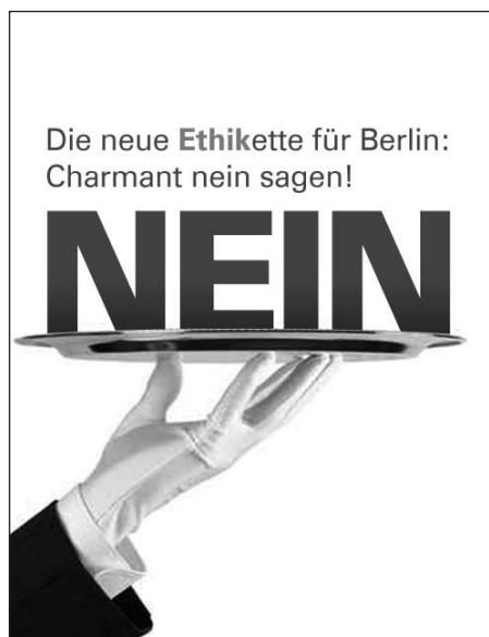
Der HVD wirbt mit dieser Postkarte um jede Nein-Stimme.

auffordert, beim Volksentscheid mit Nein zu stimmen.