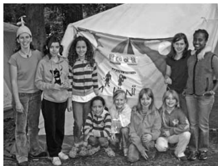
Zirkuscamp im Kinder- und Jugendgästehaus

Beim Aktivcamp auf Elba konnten die Teilnehmer/-innen auf Tauchkurs gehen und an der Atlantikküste Spaniens erkletterten die Gruppen die felsige Steilküstenlandschaft am Golf von Biscaya. Die Artistikbegeisterten kamen beim Zirkuscamp im Kinder- und Jugendgästehaus in Heiligensee ganz und gar auf ihre Kosten.