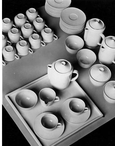
Mokkaservice Halle'sche Form

Verkehrsverbindung S 3, 5, 7 und 75, Bahnhof Tiergarten