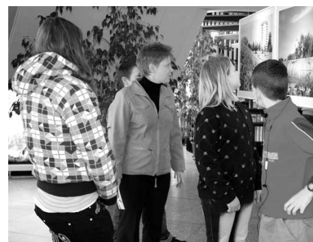
Schirmherrin Petra Pau mit den jungen Hinguckern

Zur Ausstellungseröffnung kam auch die Schirmherrin des Projekts, die Vizepräsidentin des Deutschen Bundestages und Abgeordnete der Linkspartei Petra Pau. Sie zeigte sich begeistert von den Bildern, die in beeindruckender Qualität und aus ungewöhnlichen Perspektiven ein lebendiges und grünes Marzahn-Hellersdorf zeigen. Wenn es nach Petra Pau geht, soll das Projekt, das mit Mitteln des Berliner Kulturfonds finanziert wurde, auch in diesem Feriensommer stattfinden. Auch die medienpolitische Sprecherin der Linksfraction aus dem Berliner Abgeordnetenhaus Dr.