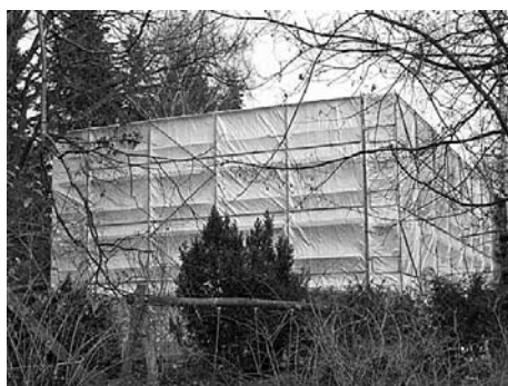
Unser Kinder- und Jugendgästehaus war lang genug eingepackt

Anfang September 2009 schlossen wir die Türen. Seither wird das Hauptgebäude mit Mitteln aus dem Konjunkturpaket II energetisch saniert. Endlich wurde die marode Asbestfassade entsorgt, das Haus gedämmt und ein neuer Putz aufgetragen. Dieser wurde nach einem restauratorischen Farb-gutachten (Denkmalschutz) angefertigt, ist hellgrau und sieht entgegen aller Bedenken gut aus. Zeitgleich wurde das Dach abgetragen, gedämmt und neu eingedeckt. Eine neue Heizungsanlage inklusive Solarzellen sowie eine Lüftungsanlage für die Schlaf-räume und die Küche wurden eingebaut. Zwischenzeitlich sah unser Haus im Bau wie ein Kunstwerk von Christo und Jean-Claude aus.