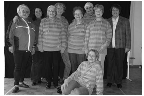
Die Pfefferstreuer (s. Jour Fixe unten mitte)