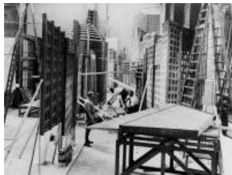
Studiobauten für METROPOLIS