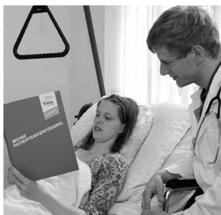
Die Optimale Patientenverfügung des HVD ist die beste Lösung für die eigene Vorsorge

Die Meinungen der Betroffenen und Experten zu diesem Fall liegen weit auseinander. Der angeklagte Schwiegersohn sagte gegenüber Medien: „Ich habe mir gedacht, wenn die Halbgötter in Weiß die Patienten-