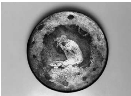
Spiegel mit Frau beim Bade

Eintritt 8 Euro, erm. 4 Euro (nicht für Rentner/-innen)