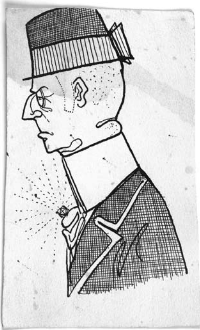
Grosz, Die leuchtende Krawattennadel, 1908

Eintritt 5 Euro, erm. 3 Euro (nicht für Rentner/-innen)