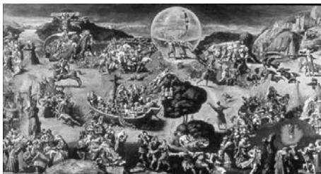
Werner Tübke: Frühbürgerliche Revolution in Deutschland

finden in der Regel ohne Führung statt. Eine Anmeldung wird bis spätestens 1 Tag vor dem angegebenen Termin erbeten. Da die meisten Verkehrsbedingungen bekannt sind, werden sie nur für besondere bzw. neue Ausstellungsorte angegeben.