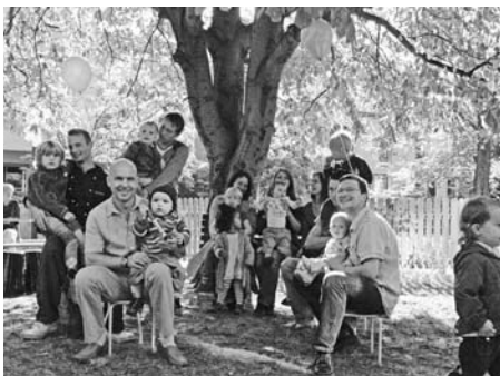
Das junge Team der Kita Bahrfeldtstraße