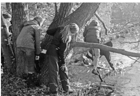
Die JuHus suchen den Stein der Weisen

Inspiriert und ein Stück weiser entwickelten die JuHus am Nachmittag Ideen für das kommende Jahr und resümierten die diesjährigen Aktivitäten. Was lief super und sollte nächstes Jahr unbedingt wieder ins Programm aufgenommen werden? Woran