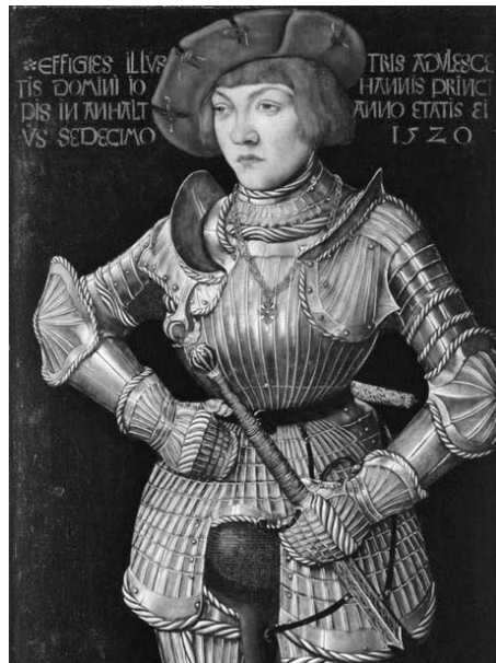
Cranach d. Ä.: „Johann, Prinz von Anhalt“