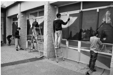
Die Jugendlichen des AF70 im Einsatz

Wir Jungen HumanistInnen (JuHu) aus dem Jugendclub AF70 haben mehr Farbe in unseren Kiez in Berlin-Lichtenberg gebracht. Gemeinsam mit Graffiti-Künstlern konnten wir in den Herbstferien Fensterscheiben eines Wohnblocks der Wohnungsbaugesellschaft HOWOGE besprühen.