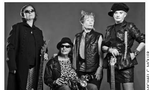
Theatergruppe „Graue Stars“

Das Theater der Erfahrungen feiert 2010 seinen 30. Geburtstag und ist damit das älteste Altentheater Deutschlands. Ein guter Grund für einen besonderen Jahreskalender! 14 Fotografen begleiteten mit ihren Kameras die Arbeit der Schauspieler/-innen und porträtierten die Gruppen aus der „Werkstatt der alten Talente“. Entstanden sind Porträts, Dokumentationen, inszenierte Fotos und Montagen über kreative alte Menschen. Allesamt Bilder, die staunen lassen und Lust zum Mitmachen wecken. Erhältlich beim Theater der Erfahrungen unter Tel. 030 8554206 oder E-Mail an theater-der-erfahrungen@nbhs.de