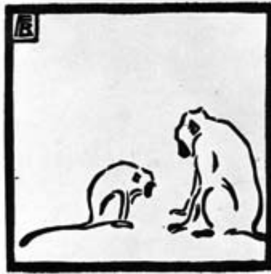
GRAFIK FRITZ BLEYL

finden in der Regel ohne Führung statt. Eine Anmeldung wird bis spätestens 1 Tag vor dem angegebenen Termin erbeten. Da die meisten Verkehrsanbindungen bekannt sind, werden sie nur für besondere bzw. neue Ausstellungsorte angegeben.