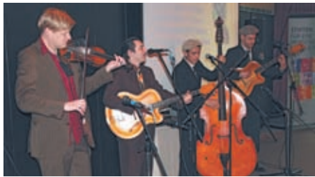
Swing Trio Berlin