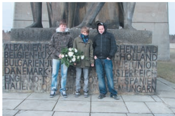
Bildungsausflug des HFH in die Gedenkstätte Sachsenhausen