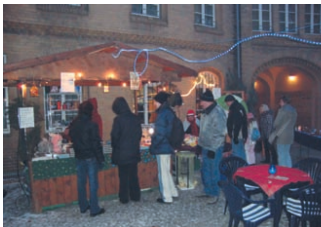
Die Nauener Tafel auf dem städtischen Weihnachtsmarkt