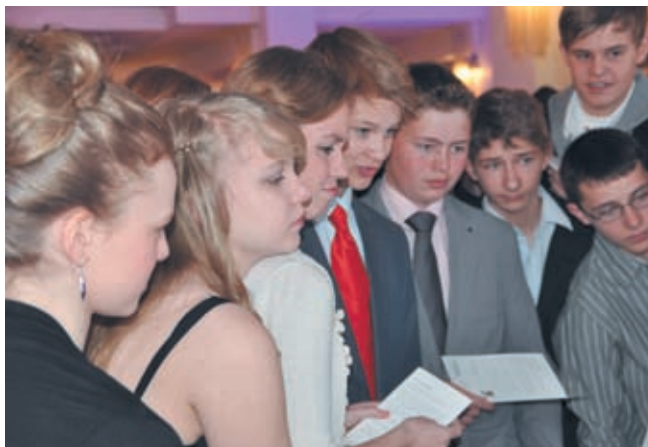
Teilnehmer einer humanistischen JugendFEIER

Das höchste Versprechen im gemeinsamen Leben zweier Menschen ist das Eheversprechen. Die Humanistische Eheschließung durch den HFH ist ein noch wenig genutztes Angebot, kann aber schon auf einige sehr schöne Erfahrungen zurückgreifen. Unsere Humanistische Heirat ist für konfessionsfreie Familien eine Alternative zur kirchlichen Trauung und ergänzt die standesamtliche Eheschließung. Selbstverständlich berücksichtigen wir die Wünsche und Vorstellungen der Eheleute, um die Feier einmalig und unvergesslich zu machen. Der Tod bedeutet das Ende eines Lebens, einer Beziehung, eines Glücks. Trauer und Verluste erleben treten ein. Mit Sterben